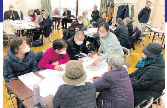
大崎地区で駅西口の再開発を知るためのおしゃべり会を開催、コーディネーター役を担った