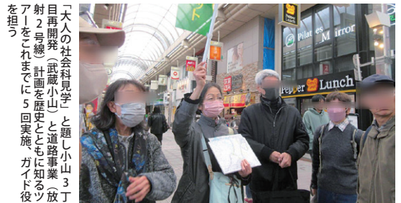
「大人の社会科見学」と題し小山3丁目再開発(武蔵小山)と道路事業(放射2号線)計画を歴史にも知るツアーをこれまでに5回実施。ガイド役を担う