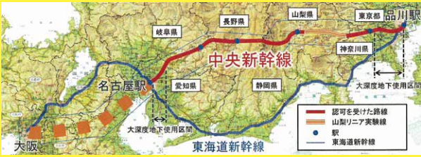
超電導リニアによる中央新幹線計画